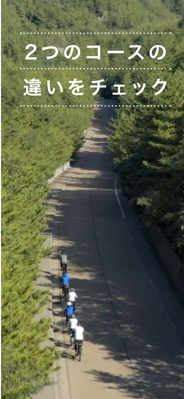
湯之平展望台へ向かう